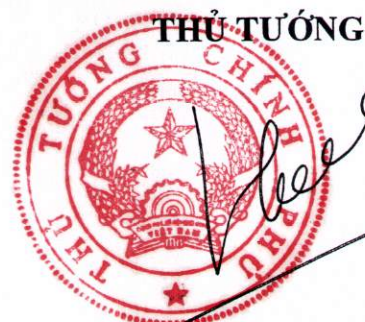
Nguyễn Xuân Phúc